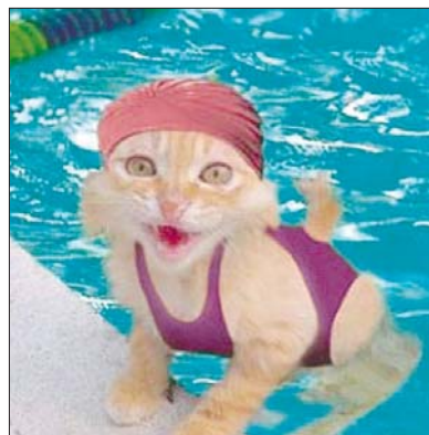
Ich hasse nasse Haare !!!

Zwei Jockeys unterhalten sich an der Theke. Sagt der eine: "Wie ernährst du denn dein Pferd?" Sagt der andere: "Mit Hafer und Bier." - "Und, schon mal was gewonnen?" - "Nee, aber mein Pferd ist immer gut drauf."